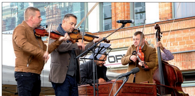
A Bürkös Zenekar több együttes produkciójához biztosította a zenei kíséretet