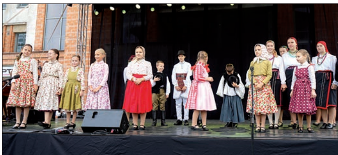
A Kállai Kettős Pöttöm és TánciKálló Néptáncsoportok táncosai