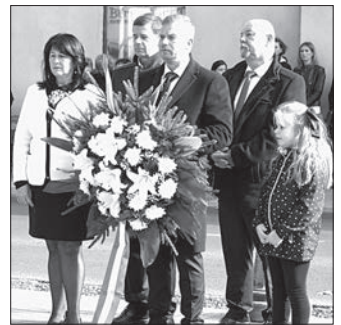
Tisztelet a hősöknek

A nagykállói megemlékezést követően a Korányi Frigyes Görögkatolikus Általános Iskola, Gimnázium és Kollégium hetedik osztályos tanulóinak „Aki magyar, velünk tart” című műsorával folytatódott. Műso-