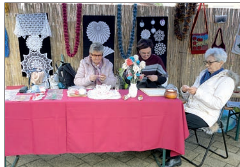
A Nagykállói Népművészeti Egyesület tagjai kiállítást és bemutatót tartottak a forгатag közönségének