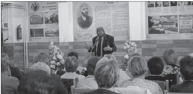
Az ország „Kató nénije” - Ihos József humorista előadása igazán jó hangulatban telt