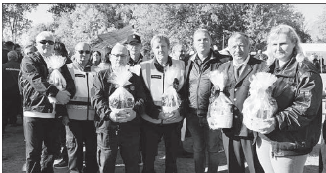
Az elismerésben részesült nagykállói polgárőrök

A vármegye 53 településéről érkező, több mint 600 polgárőrt és családtagjaikat az ünnepélyes megnyitón elsőként dr. Simon Miklós, a térség országgyűlési képviselője, az Országgyűlés Honvédelmi és Rendészeti Bizottságának alelnöke köszöntötte. Őt Baracsi Endre, a Szabolcs-Szatmár-Bereg Vármegyei