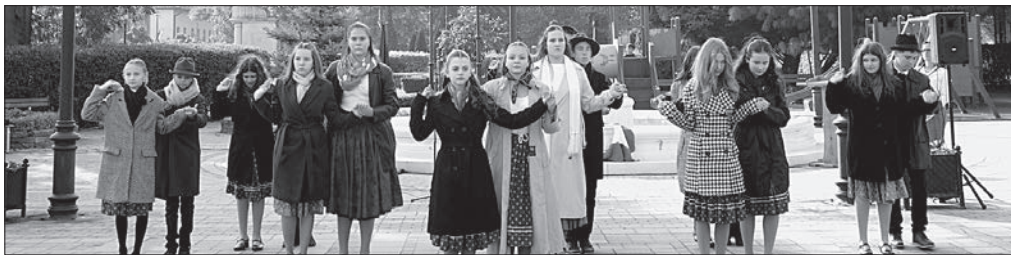
Az ünnepi műsort a korányi diákok adták

Az ünnepség végén az önkormányzat, a járási hivatal, a nemzetiségi önkormányzat, az oktatási intézmények, az egyházak és a civil szervezetek képviselői koszorúkat és virágokat helyeztek el az 1956-os emlékműnél.