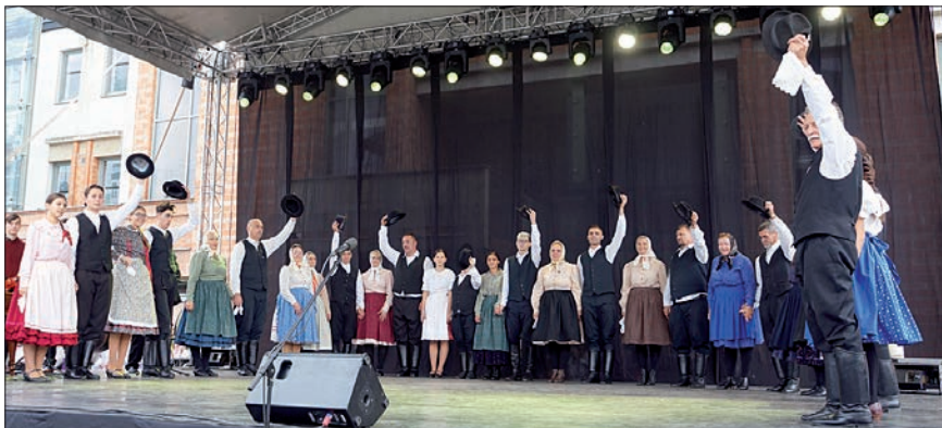
A Kállai Lakodalmas Egyesület tagjai a fesztivál színpadán