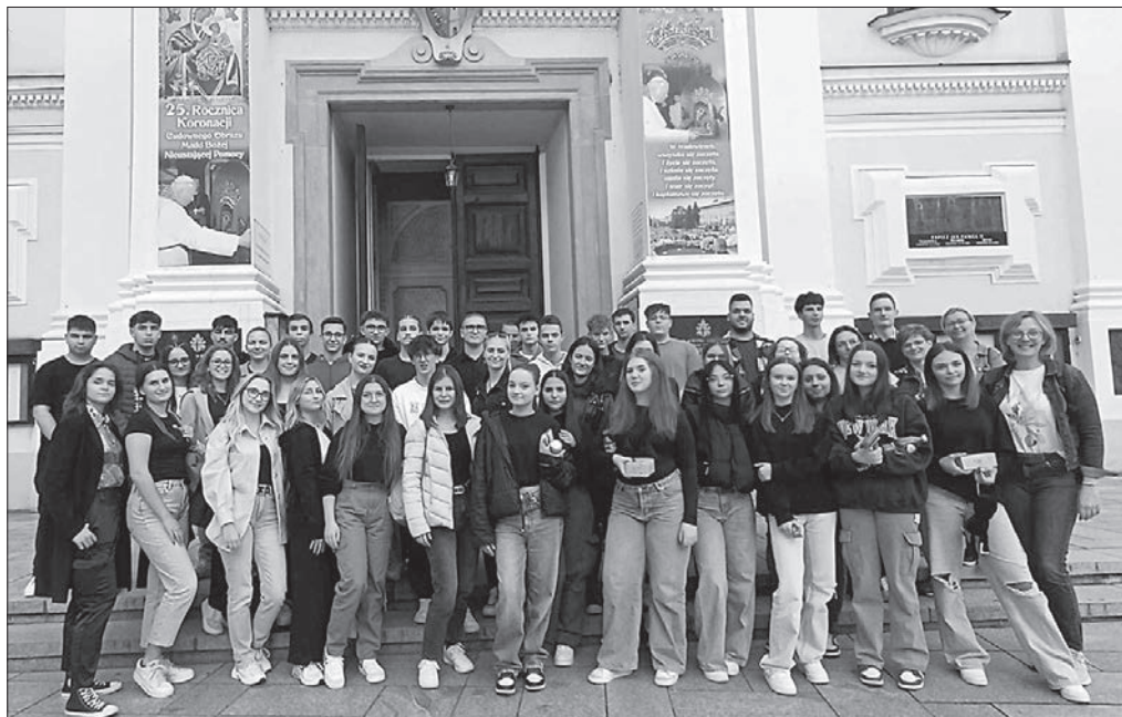
A korányisok utazásuk egyik állomásán, Wadowice-ben

örömmel fedezve fel a magyar történelemre utaló nyomokat, így Szent Kinga, Lengyelország védőszentje sóból készült szobrát, aki Árpád-házi királyunknak, IV. Bélának egyik lánya volt.