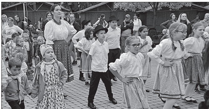
Nyíregyházán, a Kossuth téren több száz néptáncossal járták a nagykállói általános iskolások

Antal Technikum és Szakgimnázium igazgatónöje írták alá az intézmények közötti szoros együttműködés megerősítése érdekében. Ennek köszönhetően a régióban és a vármegyében is Nagykállóban indul el elsőként okleveles technikus képzés a rendészet és közszolgálat ágazaton. Az ünnepélyes aláírási ceremónián elhangzott, hogy egyedülálló lehetőséget kapnak ezzel az együttműködéssel a diákok. Dr. Kovács Gábor r. vezérőrnagy elmondta: a budais diákok a felvételikor plusz 30 kreditpont beszámítást kaphatnak, a nagykállói oktatók pedig segédanyagokhoz, továbbképzésekhez juthatnak hozzá.