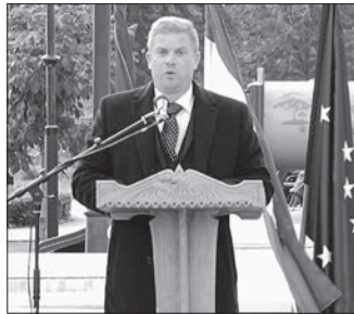
Az ünnepség szónoka

- A forradalom hősei, akik bátran kiálltak a zsarnokság ellen, példát mutattak nekünk, hogy a bátorság és az összefogás ereje képes megváltoztatni a világot. Ma, amikor a világ számos