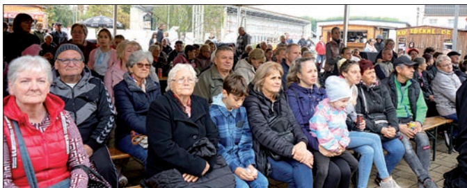
A népes közönség érdeklődése egész nap kitarított – nemhiába