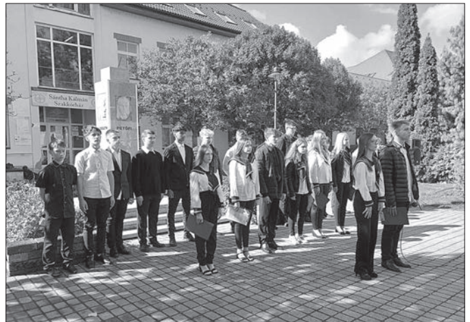
A budais diákok megható emlékműsorral készültek