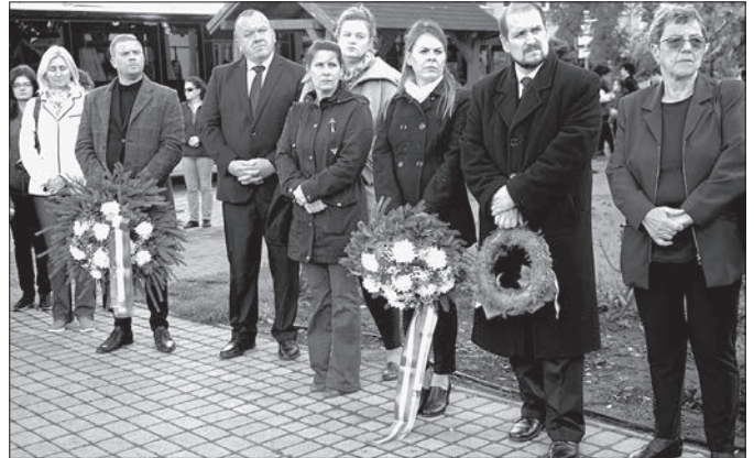
Az aradi vértanúk hősiességére emlékeztek

Az esemény zárásaként a városvezetés, az oktatási intézmények, a református egyház és bölcsőde képviselői elhelyezték a tisztelet virágait az 1848-49-es Szabadság emlékműnél.