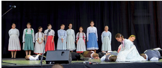
A Korányi Frigyes Görögkatolikus Általános Iskola és Gimnázium 4. A osztályának néptáncosai