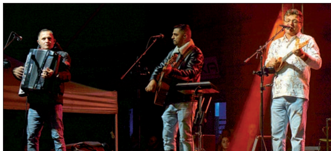
A nagyszabású eseményen - a muzsikájukban hihetetlen sokszínű elemet felölelő - Parno Graszt zenekar adott fergeteges koncertet