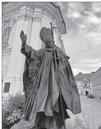
Szent II. János Pál szobra szülővárosában

Ez a három osztály szeptember 25-én indult lengyel körútjára. Az út első állomása Wieliczka volt, ahol a világ legrégebbi sóbányáját látogattuk meg. Az Unesco Világörökségi listáján is szereplő bányában feltárult a múlt, megelevenedett a korábbi századok sókitermelésének története, módszerei. A bánya kilenc szintjéből háromban is látogatást tettünk, különös