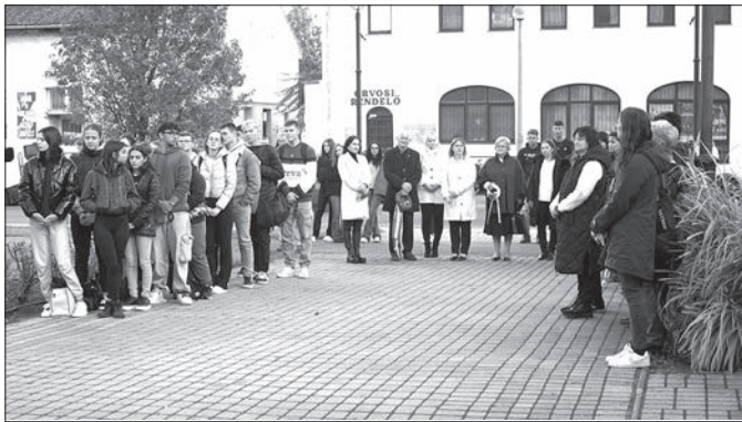
A nagykállói megemlékezés résztvevői