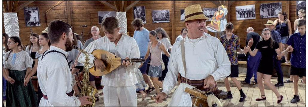
A Zöldsátor Zenekar tagjai minden tekintetben a tábor és a táncsűr középpontjában vannak