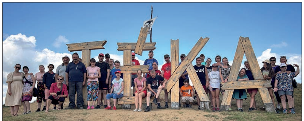
A Nyolcadiknap Egyesület tagjai idén is részt vettek a táborban