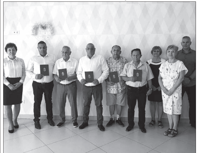
Az ősszel megalakuló Roma Nemzetiségi Önkormányzat és a Helyi Választási Bizottság tagjai az ünnepi eseményen

Az új testületek tagjai – a törvényi szabályozásnak megfelelően október 1-je után tesznek majd esküt.