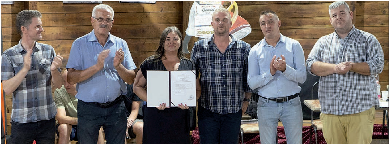
A 39. Téka Népművészeti Tábor ünnepélyes megnyitója, ahol bejelentésre került, hogy a rendezvény mostantól a Szabolcs-Szatmár-Bereg vármegyei értéklajstromba került