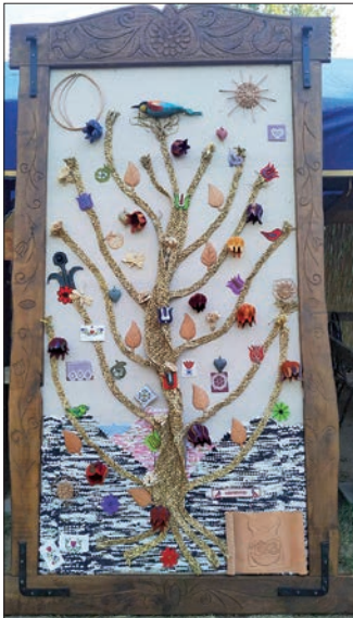
A 39. Téka Népművészeti Tábor életfája, amely a foglalkozásvezetők és a táborlakók, vagyis a mesterek és a tanítványok munkája. Az alkotás a jövőben a Nagykállói Népművészeti Egyesület kiállítótermében lesz látható (Kállai Kettős tér 1. szám alatt)