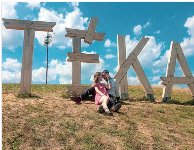
Téka tábor – Nagykovácsó-Harangod