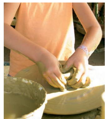
A tábor, ahol tovább adják a múltban gyökerező kulturális örökséget, elődeink kézműves hagyományát, zenéjét, táncát...