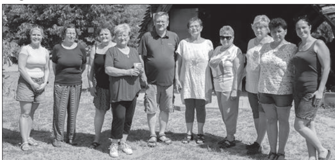
Az idei tábor segítői