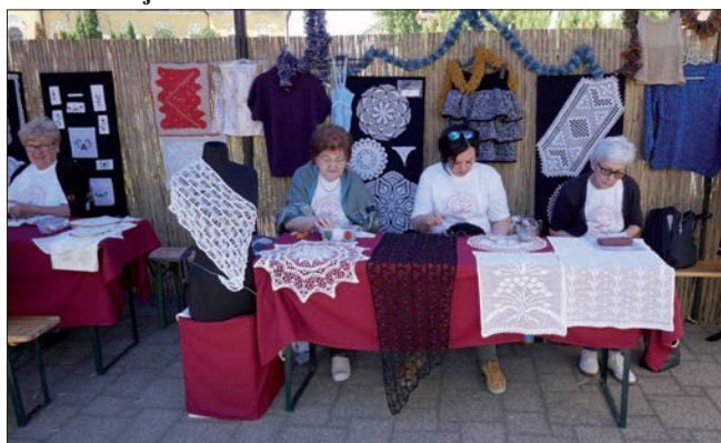
Ezúttal is „csodákat” alkottak a Nagykállói Népművészeti Egyesület tagjai