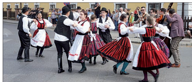
Menettánc is volt a belvárosban