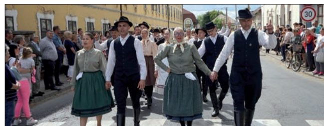
Zenés-táncos felvonuláson a Kállai Lakodalmos Egyesület tagjai