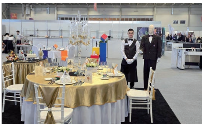
Az idei Szakma Sztárja Nagykállóból érkezett