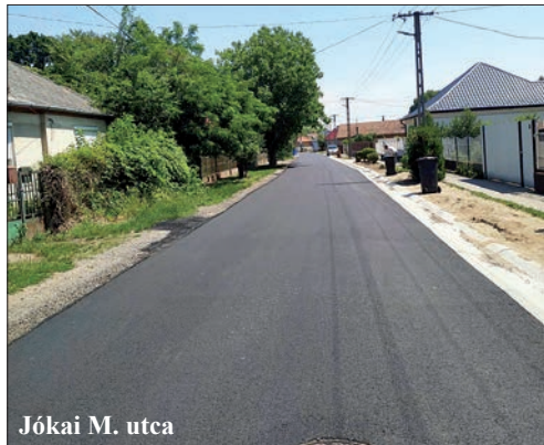
Jókai M. utca

Nagykálló Város Önkormányzata és a Nagykállói Közhasznú Nonprofit Kft. a nemzeti összetartozás napja alkalmából TRIANONI megemlékezést és koszorúzást tart 2024. június 4-én (kedden) 17.00 órakor a Szabadság téren, a Trianon emlékoszlopnál a Korányi Frigyes Görögkatolikus Általános Iskola és Gimnázium közreműködésével.