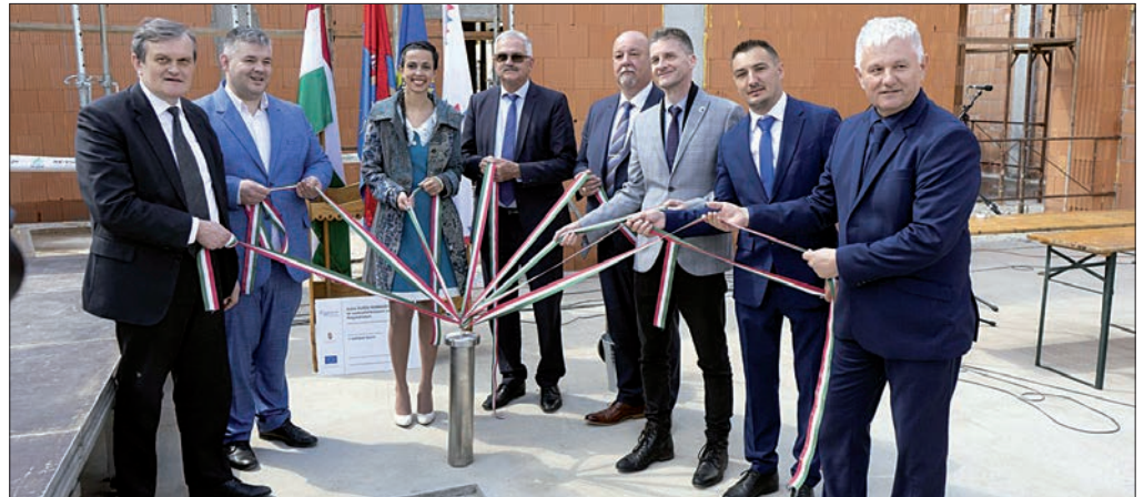
Elhelyezték az időkapuszulát, amely - egyebek mellett - az épület tervrajzát és a Nagykovácsó Hírmondó előző számát tartalmazta

Dr. Koncz Zsófia parlamenti államtitkár köszöntőjében azt emelte ki, hogy a Kállai Kettős Rendezvény- és Konferenciaközpont építése egy örömmel, majd így folytatta: „Nagykovácsról sokaknak a Kállai Kettős jut eszébe, ami a magyar identitás része, és méltán lehetünk büszkéek rá. Minden ember és település éle-