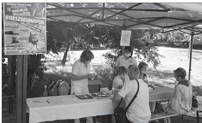
Az egészségnapokat is a projekt keretében szervezték meg Nagykállóban

Az Emberi Erőforrások Minisztériuma 493 709 157 forint vissza nem térítendő támogatásban részesítette a konzorciumi megállapodást kötött Nagykálló, Biri, Bököny, Geszteréd, Fábíánháza, Kisléta és Vállaj településeket az EFOP-1.5.3-16-2017-00041 azonosítószámú „Humán szolgáltatások fejlesztése Nagykállóban és térségében” elnevezésű projekt keretében.