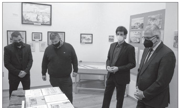
A tárlók relikviákat rejtenek a nagykállói várról