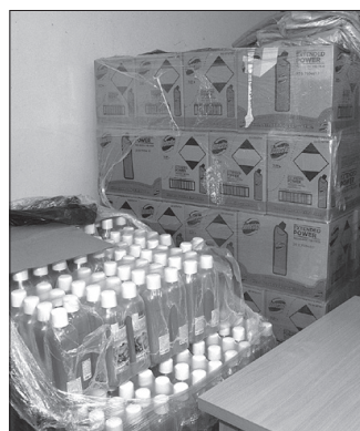
Tisztasági csomagokat is osztottak a EFOP programnak köszönhetően