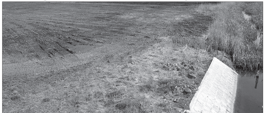
Egyelőre csak csordogál a víz a tározóba

közelítése, valamint a körbejárhatóságának lehető legnagyobb mértékű biztosítása érdekében az északi záróöltésen 400 m hosszban aszfaltburkolat, a nyugati töltésen 1100 m hosszban kőszórással stabilizáció és keleti, dél-keleti oldalon 2860 m hosszban új szervízutak kerültek kialakításra.