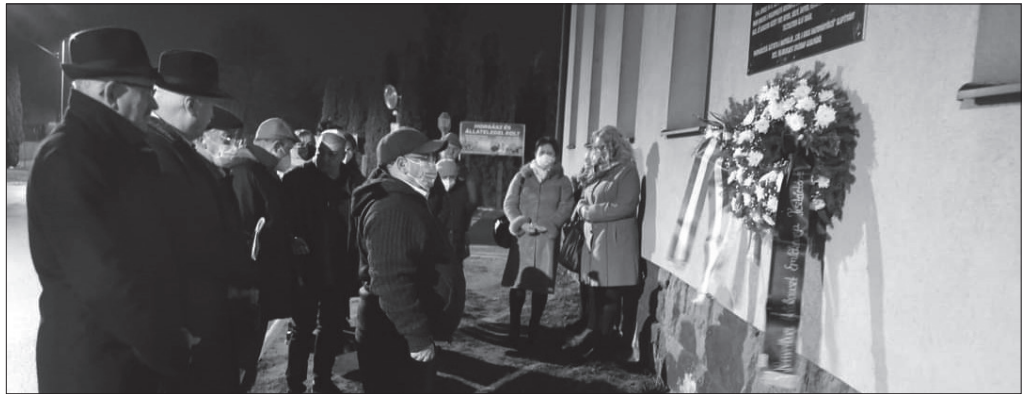
Fóhajtás a nagykállói áldozatok emléke előtt

A „Szól a kakas Hagymányörző” Alapítvány megemlékezéssel egybekötött koszorúzást tartott a holokauszttal áldozatainak nemzetközi emléknapja alkalmából Minden év január 27. napja a holokauszttal áldozatainak