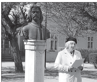
Harsányi Gézáne tartott emlékbeszédet II. Rákóczi Ferencről

A Sárospataki várban látható az a térkép, amely szerint az ifjú Rákóczi Ferenc születésekor Rákóczi birtokok, majorságok voltak Kálló környékén. Az újszülött néhány hetes csupán, amikor édesapját meggyilkolják, méltó eltemetésére is csaknem másfél évet kell várnia a családnak, mert