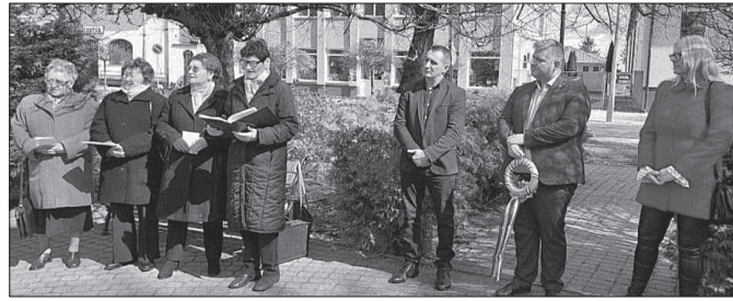
Emlékezők a Nagyságos Fejedelem mellszobránál

a háborús fenyegettség miatt előbb lehetetlen.