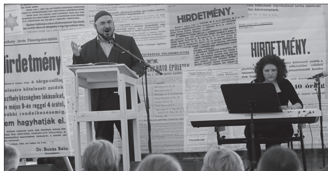
A megemlékezést záró koncert első része a fájdalomé volt, a második pedig a reményé