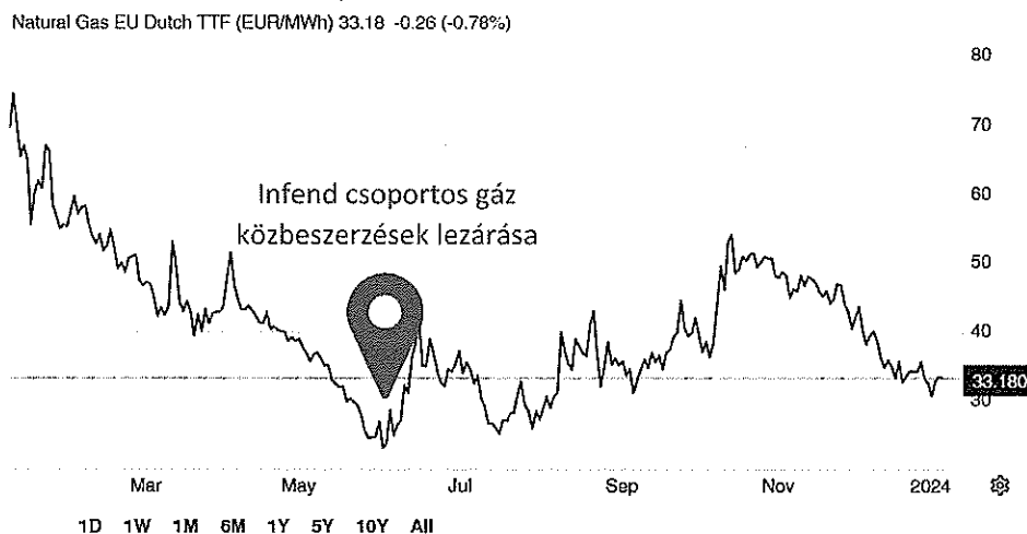
1. ábra: Földgáz piaci ár 2024. január

indukálja a fűtés iránti keresletet. Párizstól Berlinig fagyponthoz alatti hőmérséklet várható, mely január közepéig tart. Emellett a gáztüzelésű erőművek kihasználtsága valószínűleg növekedni fog, mivel a megújuló energia termelése az előrejelzések szerint csökkenni fog. A gázmérlegre gyakorolt hatás azonban korlátozott lesz, mivel a tárolók továbbra is telítettek maradnak a szokásosnál, és elegendő mennyiséget szállítanak csővezetéseken és tartályhajókon keresztül. Az Európai Unióban, így Németországban, Franciaországban és Olaszországban a gáztárolási szint 2024 januárjában 81% és 91% között mozog.