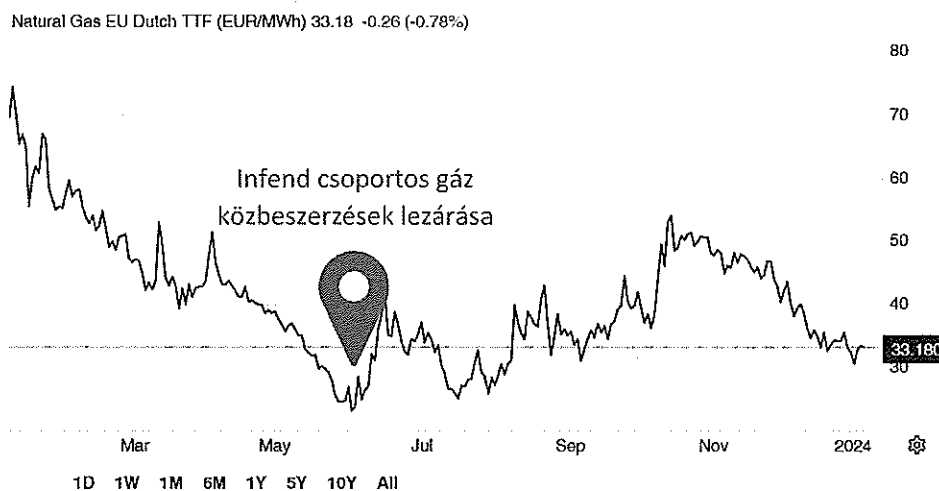
1. ábra: Földgáz piaci ár 2024. január

indukálja a fűtés iránti keresletet. Párizstól Berlinig fagyponthoz alatti hőmérséklet várható, mely január közepéig tart. Emellett a gáztüzelésű erőművek kihasználtsága valószínűleg növekedni fog, mivel a megújuló energia termelése az előrejelzések szerint csökkenni fog. A gázmérlegre gyakorolt hatás azonban korlátozott lesz, mivel a tárolók továbbra is telítettek maradnak a szokásosnál, és elegendő mennyiséget szállítanak csővezetéseken és tartályhajókon keresztül. Az Európai Unióban, így Németországban, Franciaországban és Olaszországban a gáztárolási szint 2024 januárjában 81% és 91% között mozog.