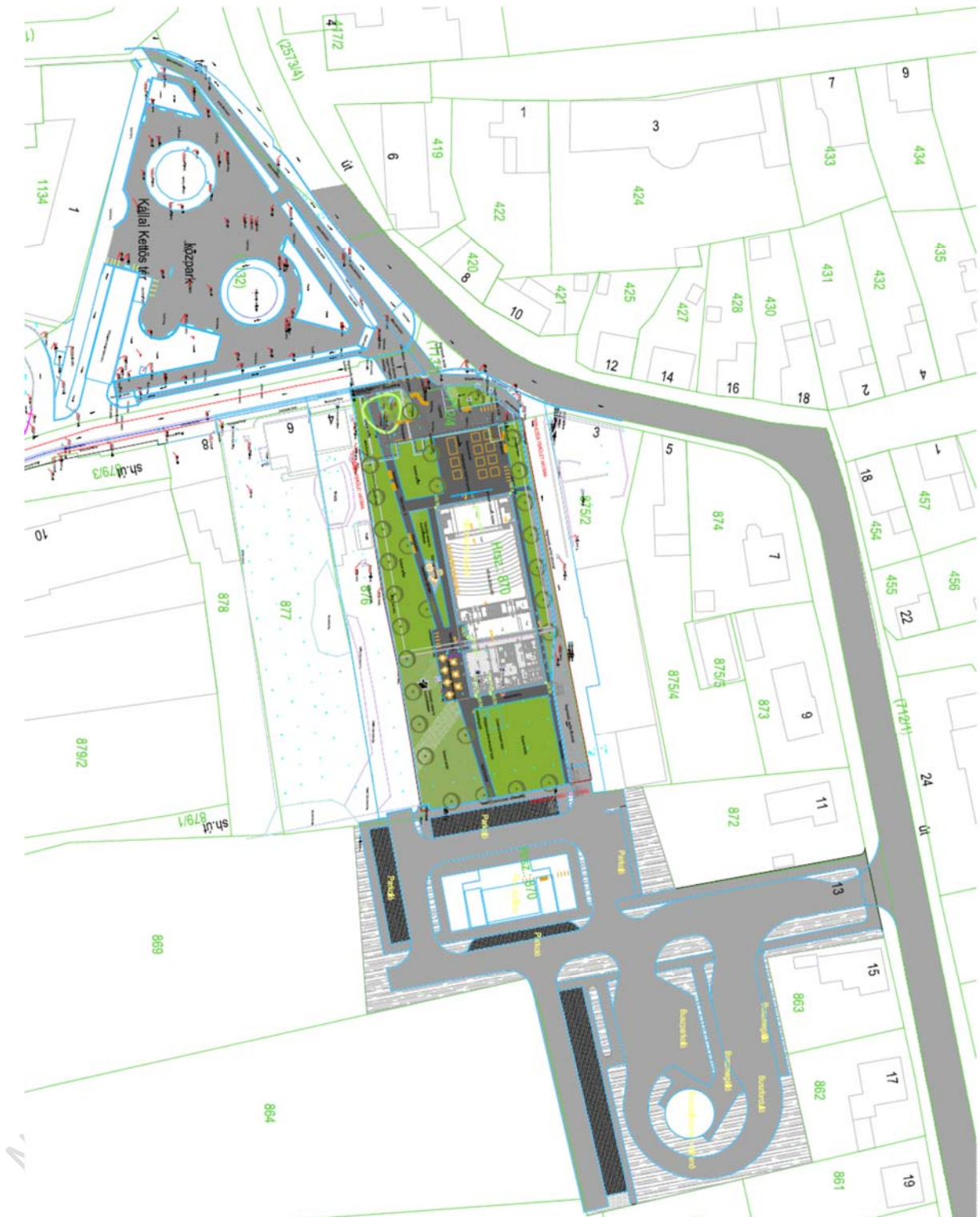
A környezetrendezési terv és a Rendezvényház helyszínrajza

A 314/2012.(XI.8.) Korm. rendelet 42.§. szerinti tárgyalásos eljárás 38.§ szerinti véleménykérő dokumentációja